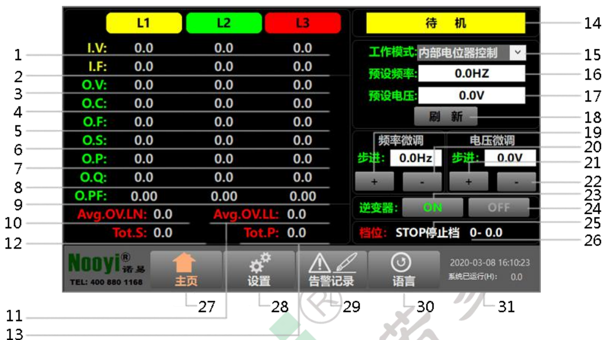
图 3 触摸屏显示主界面